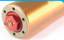
Cartucho Horquilla Regulable Adjustable Fork Cartridge