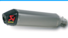
Escape Completo Akrapovic Akrapovic Exhaust System