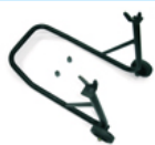
Cabalete Rear Stand