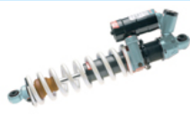
Amortiguador GP GP Shock Absorber