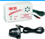
Cronómetro Lap Timer